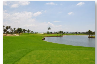
Left: The Schmidt-Curley Design course rendering shows the extent to which Nanli Lake comes into play at Nanlihu Golf Club Top and Bottom Right: Two tee views at Poly Silver Beach Golf Club showing the variety of challenges that golfers will face

visual feast. And the golf is top-notch too! Playing across sand dunes and numerous water features, the design complements the natural surroundings and tests players with a wide variety