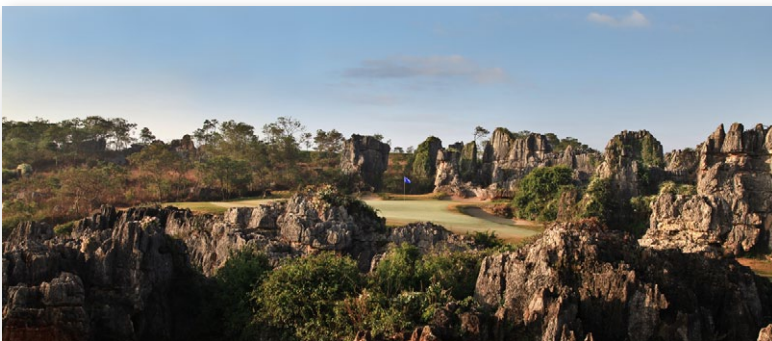
Above: The Leader's Peak Course at Stone Forest International CC, one of the three spectacular courses at this facility near Kunming. Right: Mission Hills Haikou's Lava Fields Course was ranked at No. 3 alongside its sister-course, Blackstone, at No. 5.

This is a wonderful tribute to the work that our construction management team has done across China on a wide variety of sites, terrains and climates. We thank and congratulate our colleagues and clients at these courses for their ongoing hard work to keep these world-class facilities at the front of the pack!