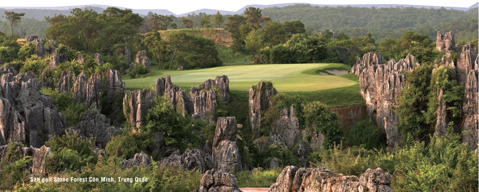
Sân golf Stone Forest Côn Minh, Trung Quốc

"Tôi nhận ra rằng, tôi yêu bầu không khí làm việc ngoài trời và đơn giản là được xuất hiện xung quanh với golf. Golf vô cùng đặc biệt với tôi vì giá trị lịch sử, giá trị truyền thống, các quy tắc của ứng xử và nghi thức của nó, và trên hết là vẻ đẹp của các sân golf'.